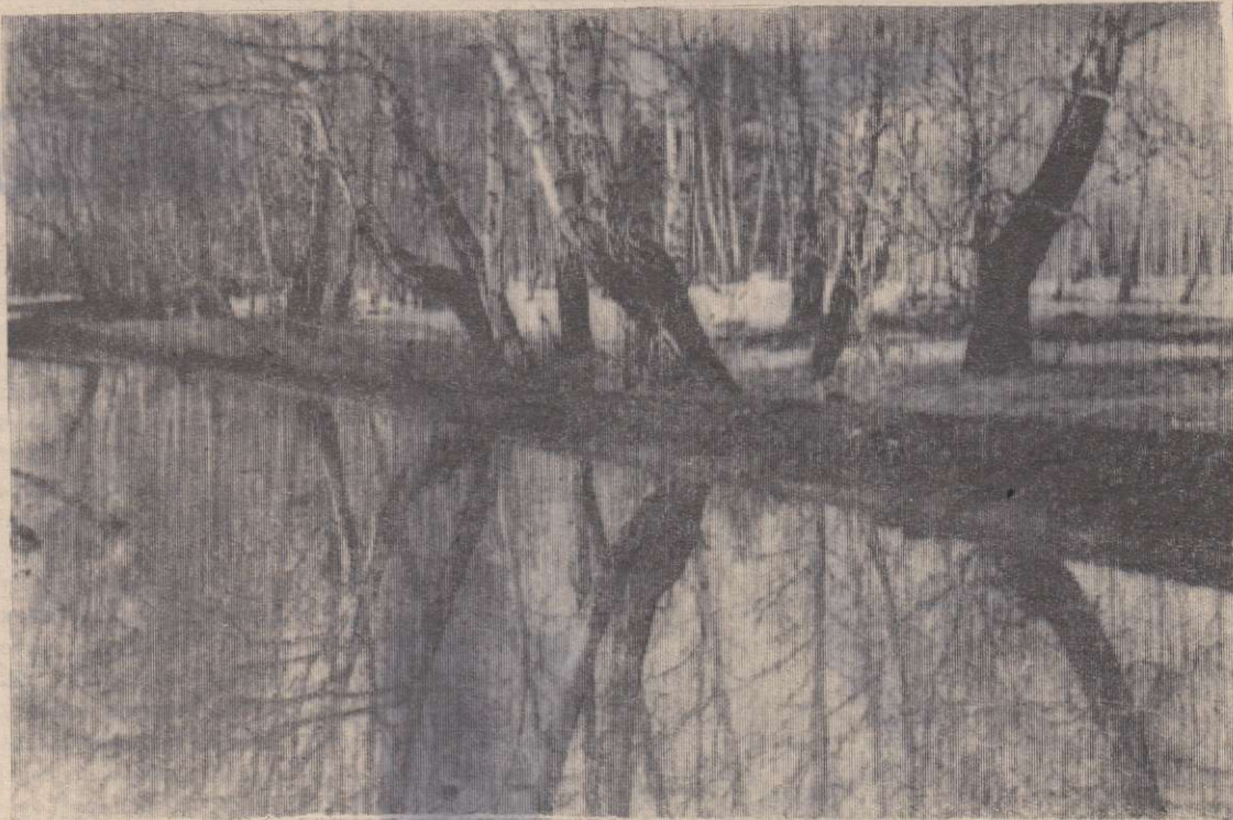
ВЕСНА В ОКРЕСТНОСТЯХ НИЖНЕГО ТАНАЯ.