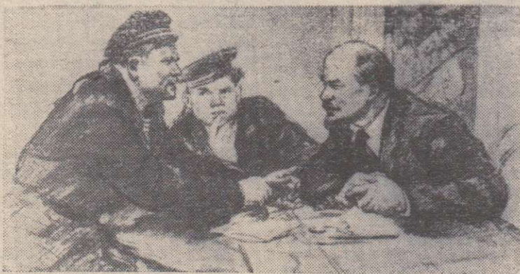
ВЕСТИ С ФРОНТА